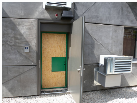
Vchod do spodního podlaží vybavený vyrážecími dveřmi.