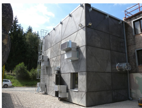
Napojení stávající lezecké věže na nový objekt střelnice.