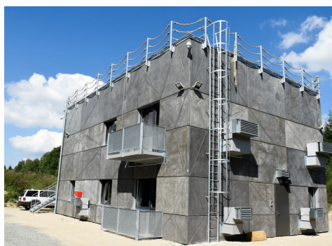
Ventilační systém a cvičný žebřík.