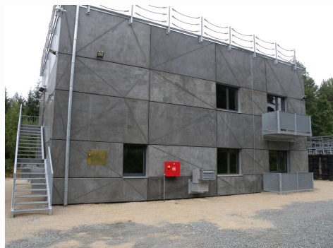
Dvoupodlažní střelnice se schodištěm do prvního podlaží.