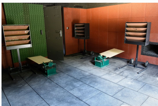
Příklad použití terčového vybavení a balistické ochrany.